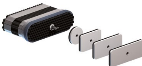
Zehnder ComfoSet Flat 51