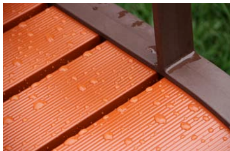
Latte tuile / Piètement marron