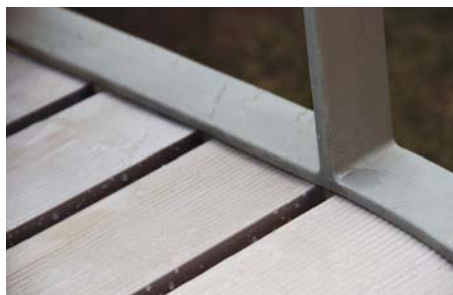
Latte beige / Piètement gris