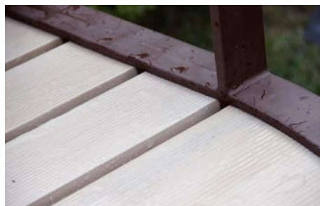
Latte beige / Piètement marron