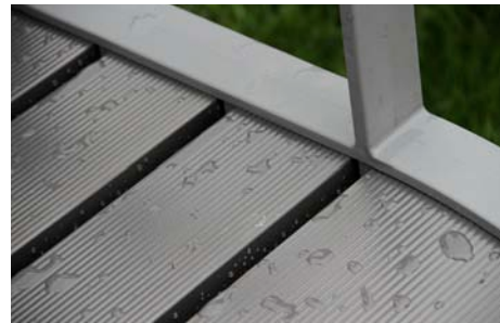
Latte gris / Piètement gris