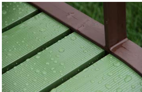
Latte vert / Piètement marron