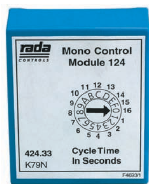
A. Unidad de Control