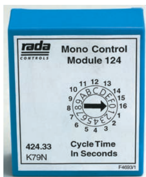
A. Unidad de Control