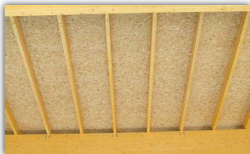
Acabado interior en OSB 3 de 10 mm

TABLERO DE VIRUTAS ORIENTADAS OSB 3 DE 10 mm