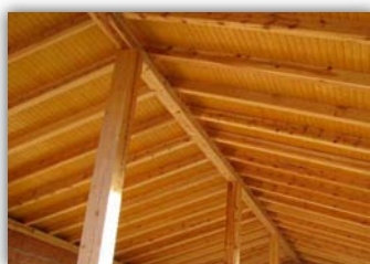
Friso Abeto Barnizado Miel