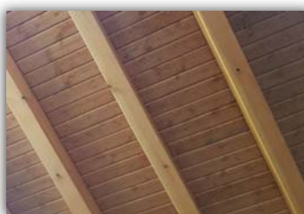
Friso Abeto Barnizado Nogal