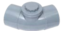
Codo registrable H-H 45°