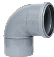
Codo M-H 87° 30' con junta elástica