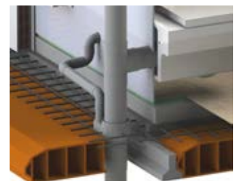
Ejemplo de instalación embutido