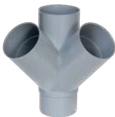
Injerto doble a escuadra M-H 45°