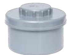
Tapón de registro roscado