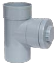
Injerto 87° 30' M-H registrable