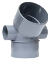
Codo M-H 45° con doble toma lateral Ø50