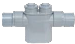
Sifón en línea registrable