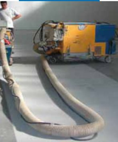
Preparación del soporte mediante granallado