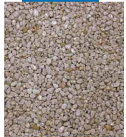
Aplicación de la mezcla de áridos naturales + Mapefloor I 910