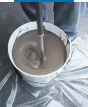
Preparación del producto con agitador mecánico