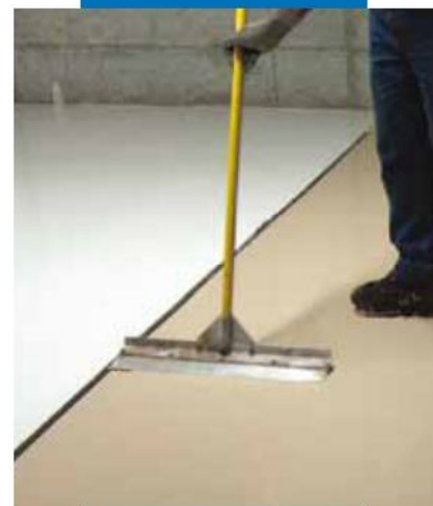
Alisado de Ultratop, con llana lisa, justo después de la extensión