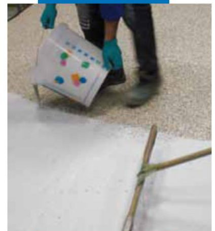
Aplicación de Ultratop sobre la superficie endurecida del recrecido de áridos naturales + Mapefloor I 910