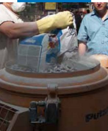
Preparación del producto en la máquina antes del bombeo

De acuerdo con la norma EN 13813 : 2002, Ultratop está clasificado como CT-C40-F10-A9-A2 ff -s1. CT indica que el producto es de base cementosa; C40 y F10 se refieren, respectivamente, a la resistencia a compresión y a flexión a 28 días, A9 es el índice de resistencia a la abrasión según Böhme y A2 ff -s1 es la clase de reacción al fuego.