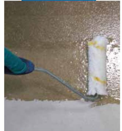
Efecto "Terrazo a la veneciana": extensión de Mapefloor I 910

Preparar Ultratop según la descripción del párrafo " MODO DE APLICACIÓN - Preparación de la mezcla " y aplicar el mortero fresco sobre la superficie endurecida del recrecido de áridos, cuidando el relleno a saturación de todos los huecos e intersticios de la estructura. Esta operación se realizará con el empleo de una llana lisa de goma que ayude a la penetración del mortero hasta el soporte.