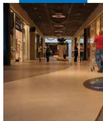
Pavimento de Ultratop acabado