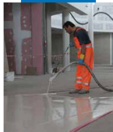
Aplicación a máquina de Ultratop