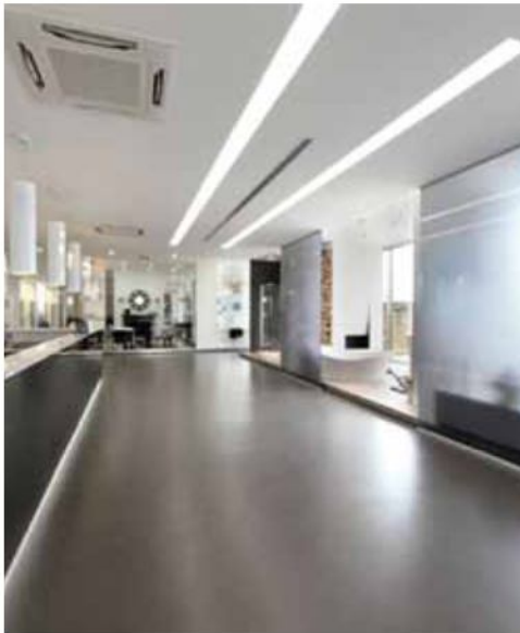
Sala de exposición Quartarella Altamura (Bari) Italia. Ultratop antracita - "efecto natural"