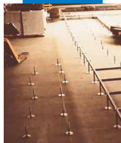
Solera nivelada con Ultraplan para la puesta en obra de pavimentos sobreelevados