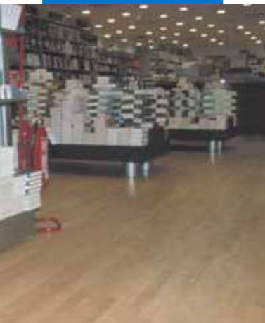
Ejemplo de colocación de madera realizada sobre nivelación de Ultraplan - Messaggerie Musicali - Roma - Italia