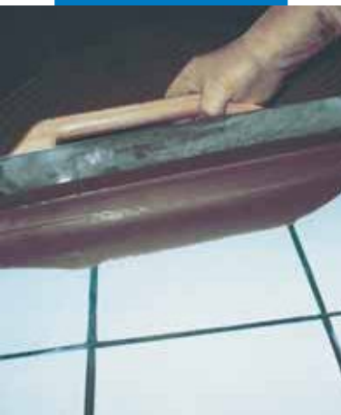
Extensión con llana metálica sobre pavimento existente de cerámica, previa aplicación de Mapeprim SP