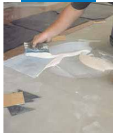
Ejemplo de colocación de PVC sobre nivelación de Ultraplan - Milán - Italia