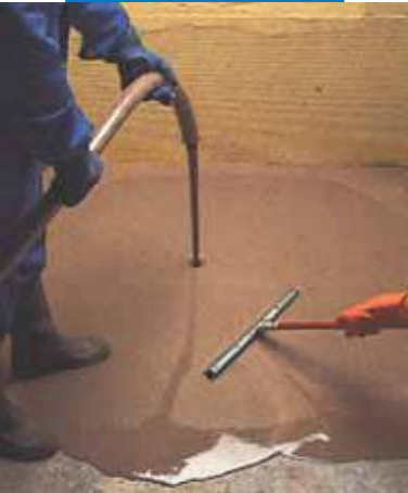
Aplicación de Ultraplan con bomba y posterior rastrillado