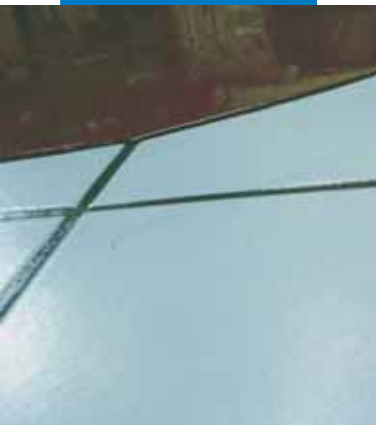
Ejemplo de aplicación de Ultraplan sobre pavimento de cerámica existente, previa aplicación de Mapeprim SP