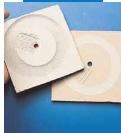
Abrasión Taber realizada sobre Ultraplan (derecha) y alisado convencional (izquierda) después de 200 vueltas