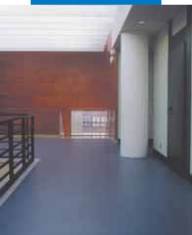
Ejemplo de instalación de linóleo realizada sobre nivelación de Ultraplan - Conservatorio de Monzón - España

Dada la extraordinaria característica de autonivelación, Ultraplan elimina inmediatamente las pequeñas imperfecciones (rebabas del alisado, etc.). En el caso que sea necesaria una segunda capa, se recomienda aplicarla cuando la anterior sea transitable (aprox. 3 horas a +23°C).