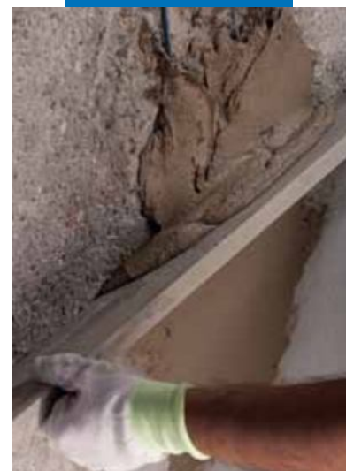
Regleado de Planitop Rasa & Ripara