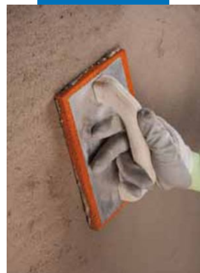
Fratasado de Planitop Rasa & Ripara