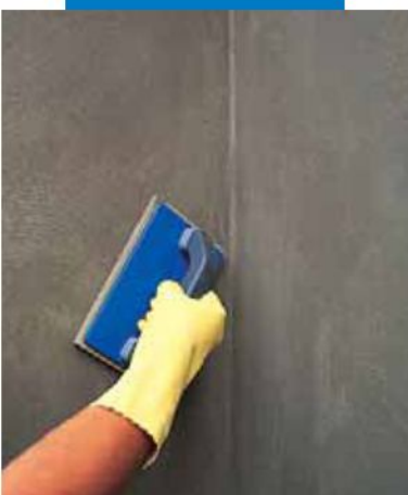
Acabado con fratas de esponja