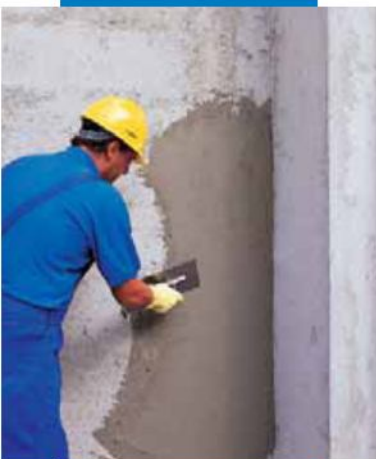
Aplicación a llana