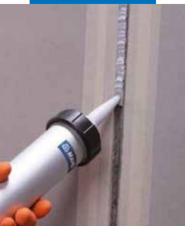
Aplicación de Mapeflex PU40