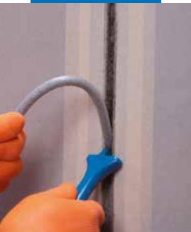
Insertar Mapefoam en el interior de la sede de la junta