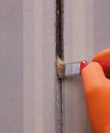
Aplicación de Primer M