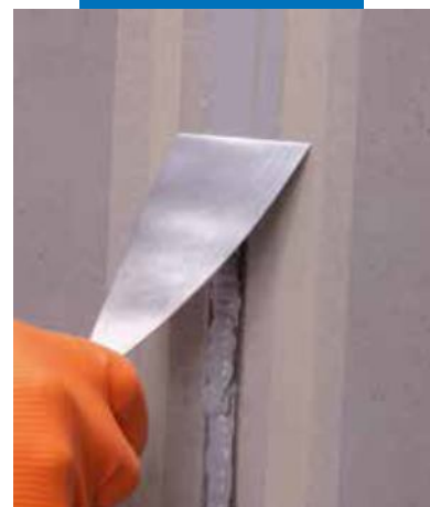
Alisado de Mapeflex PU40