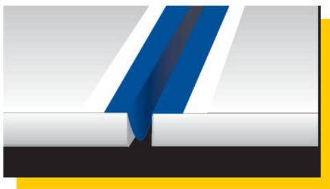
Colocación en omega de Mapeband en el interior de la junta de dilatación