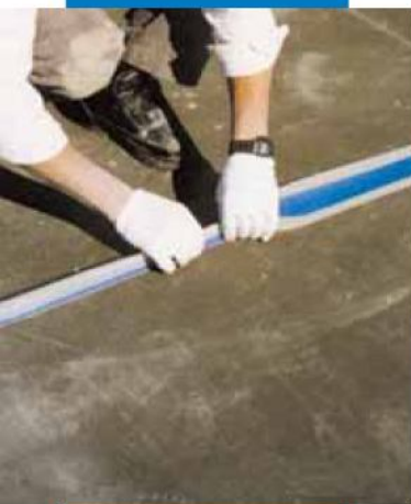
Ejemplo de impermeabilización de una junta estructural en una terraza