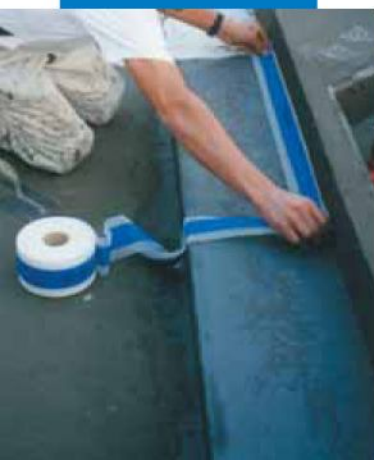
Ejemplo de impermeabilización con Mapeband del encuentro entre la losa y el muro de un depósito