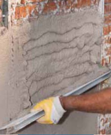
Regleado de Mape-Antique Intonaco NHL