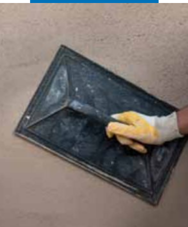
Fratasado de Mape-Antique Intonaco NHL