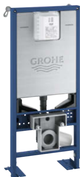
39 599 000 Rapid SLX WC 3-6 | 1,13 m F, con patas para carga pesada Módulo Rapid SLX para inodoro, altura de instalación de 1,13 m con cisterna de descarga GD2, enchufe eléctrico, control de flujo, acceso sencillo y totalmente aislado frente a la condensación. Con patas para carga pesada.