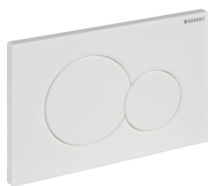
Imagen de ejemplo