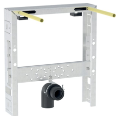
Imagen de ejemplo