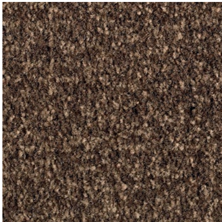
Marrón de diseño 81.04