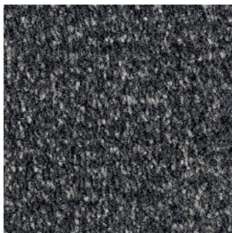
Antracita de diseño 81.02