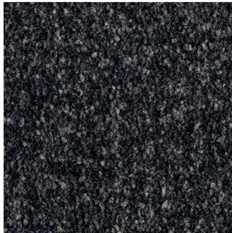
Negro de diseño 81.01