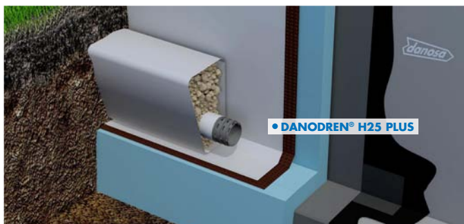
Muro flexorresistente con LBM (SBS)