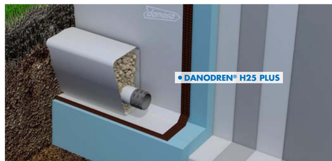
Muro flexorresistente con PVC