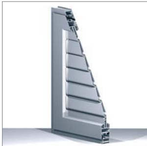
Sistema de contraventana de lamas fijas u orientables.