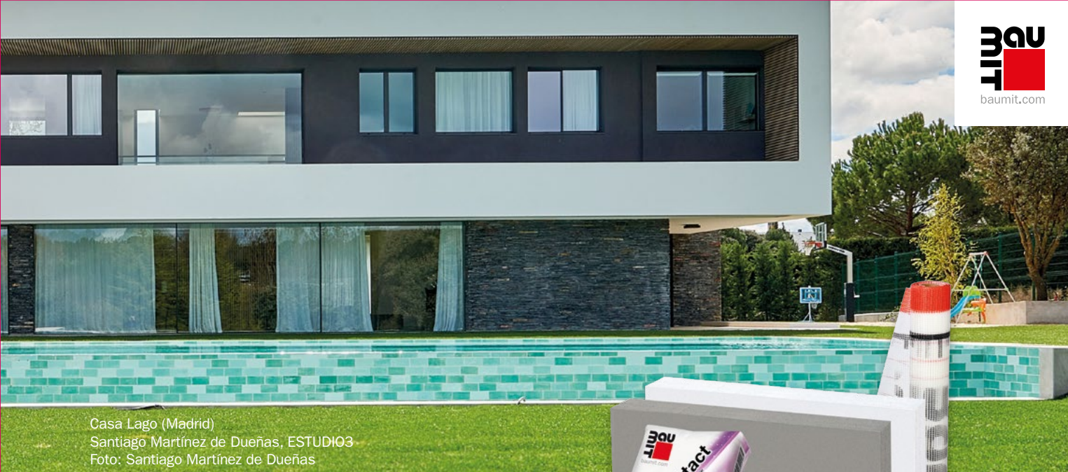
Casa Lago (Madrid) Santiago Martínez de Dueñas, ESTUDIO03