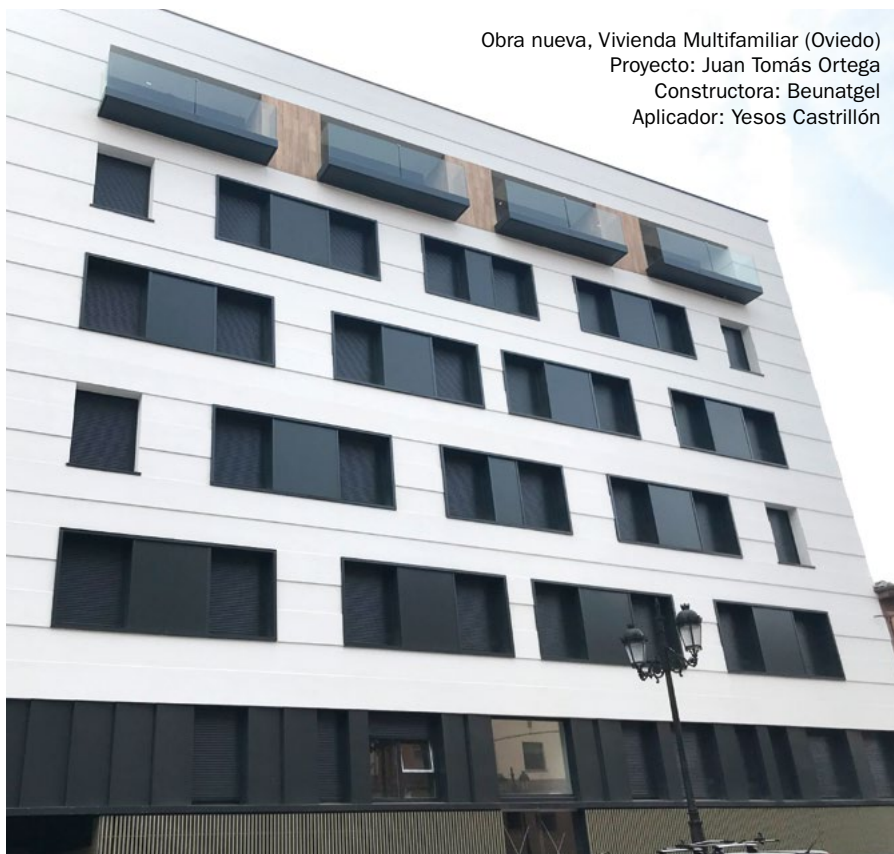
Obra nueva, Vivienda Multifamiliar (Oviedo) Proyecto: Juan Tomás Ortega Constructora: Beunatgel Aplicador: Yesos Castrillón

Cuando en la construcción o rehabilitación de grandes obras prima un procedimiento sistemático, Baumit ProSystem es la solución más indicada gracias a la facilidad de aplicación de Baumit ProContact, mortero adhesivo y de refuerzo que junto con Baumit StarTex, la malla de fibra de vidrio, libre de álcalis, garantiza la compactación