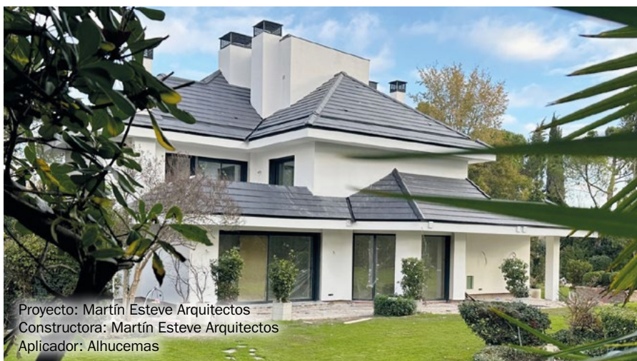
Proyecto: Martín Esteve Arquitectos Constructora: Martín Esteve Arquitectos Aplicador: Alhucemas