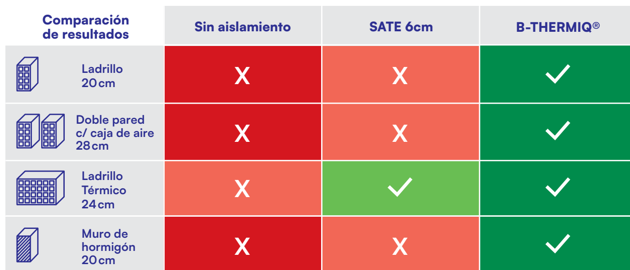
CUADRO COMPARATIVO DE DESEMPEÑO ENERGÉTICO

* Requisitos mínimos de eficiencia energética aplicables a la envolvente opaca de los edificios de viviendas en España peninsular, U máx. [W/(m 2 ·°C)] zona climática i3 — según el Código Técnico de la Edificación (CTE), Documento Básico DB-HE, vigente desde 2019.