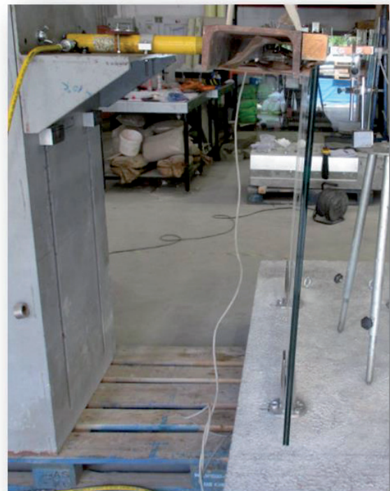
Aspecto tras el empuje horizontal hacia el exterior