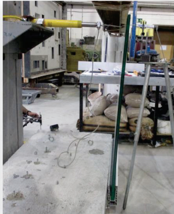
Aspecto tras el empuje horizontal hacia el exterior