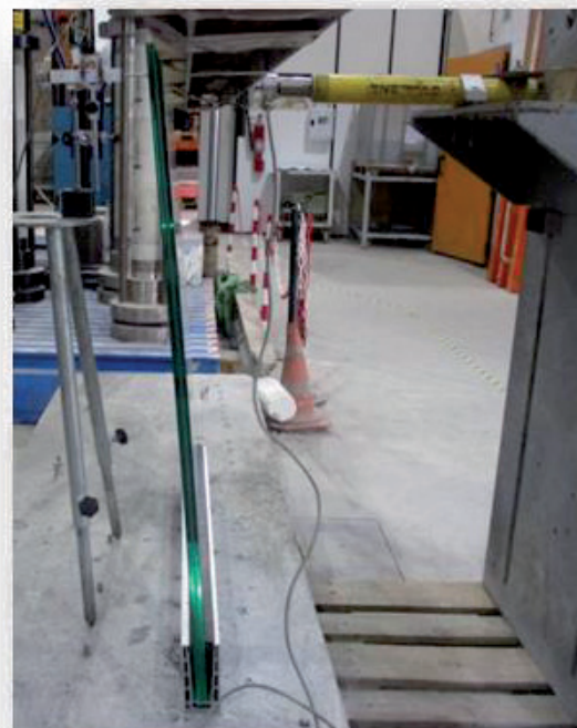
Aspecto tras el empuje horizontal hacia el exterior